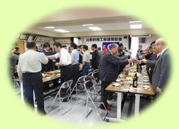
県の乾杯条例により「地酒」ワインによる乾杯