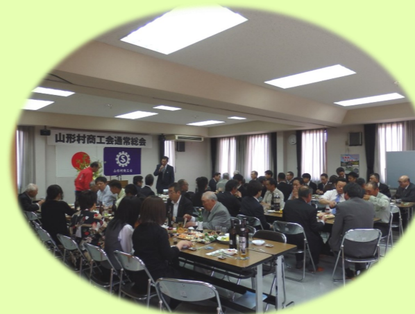
本庄村長による来賓祝辞

海外では相次ぐテロの発生や北朝鮮のミサイル問題などを抱え、我が国にとっても脅威が増し「安全」に対する認識が変わりつつあります。▼山形村商工会の総会も終了し、新年度の事業がスタートしました。昨年は新たに11名の会員加入があり、脱退が2名で9名の会員が増加し、加入率では県下トップとなりました。県下69商工会のうち前年度より会員が減少した商工会は46商工会、丁度3分の2です。県全体では96名が減少し、19,943名と2万名の大台を割ってしまいました。会員が増えた理由をよく聞かれますが、山形村は松本に隣接し就労環境に富み、自然環境にも恵まれた住みよい環境が安定的に人口を維持しており、事業を行う上での雇用の確保や流通の利便性、大型商業集積などによるビジネスチャンスの増加から、新規開業や村外からの事業所移転などが増えてきているのではないかと思います。▼昨年から会報の自主制作をスタートし、それまで年2回発行していたものを5回発行しました。この「西山」も5人の職員がそれぞれ1回ずつ担当して掲載しています。興味をもって読んでいただければ幸いです。(大)