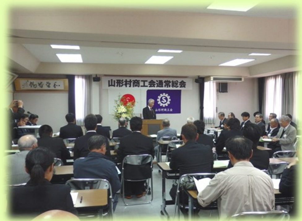
平成29年度通常総会