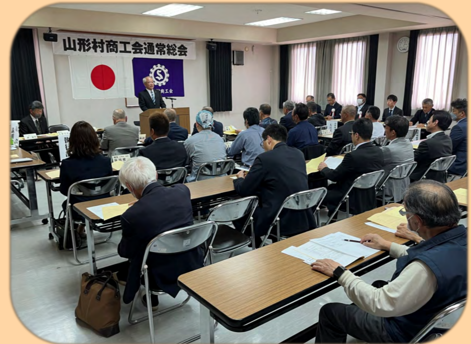
令和6年5月15日(水) 山形村商工会通常総会