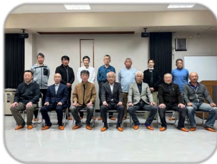
< ~令和6年(5/15まで)旧役員 >